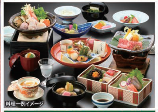
料理一例イメージ

【設定期間】2023年7月1日▶2024年9月30日迄 ※年末年始等、設定除外日がございます。