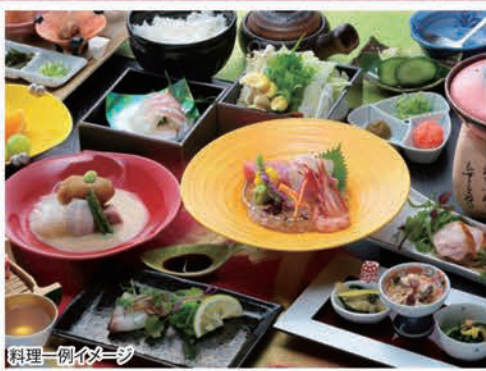
料理一例イメージ

【設定期間】2023年7月1日▶2024年9月30日迄 ※年末年始等、設定除外日がございます。