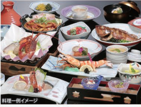
料理一例イメージ

【設定期間】2023年7月1日▶2024年9月30日迄 ※年末年始等、設定除外日がございます。