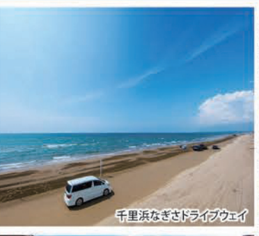
千里浜なぎさドライブウェイ